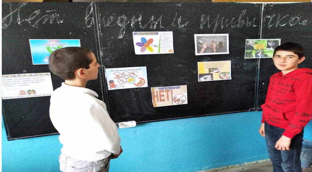
Раздача информационных буклетов по здоровому образу жизни.