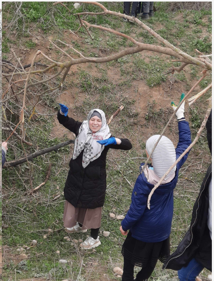
Выпустили экологическую стенгазету.