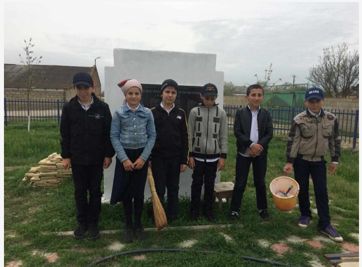
Уборка пришкольной территории.